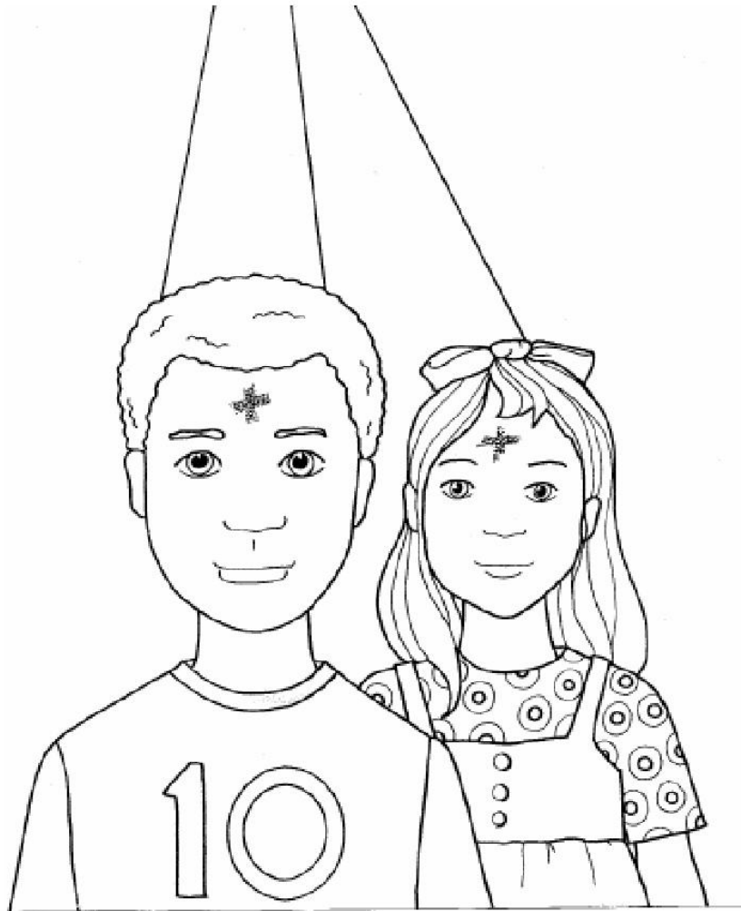
Miércoles de Ceniza